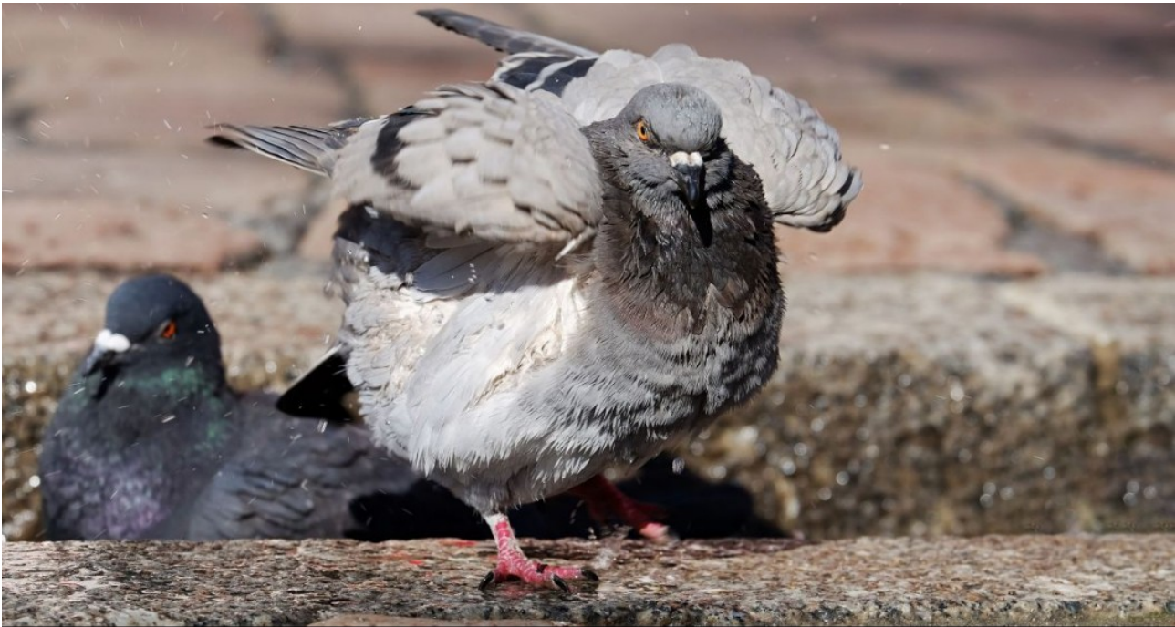
Les pigeons de Sablé-sur-Sarthe vont y laisser des plumes