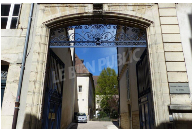
■ L'entrée du Tribunal administratif de Dijon.

Lorsque l'administration prend une décision qui vous est défavorable, vous pouvez, comme l'association Nos Amis les oiseaux (Nalo), lui demander de revoir sa décision par un recours administratif. Il peut être gracieux ou hiérarchique selon qu'il s'adresse directement à la personne qui a pris la décision ou à son supérieur hiérarchique. Le recours est libre et gratuit. Voici ci-dessous plus de détails grâce au site Internet service-public.fr .