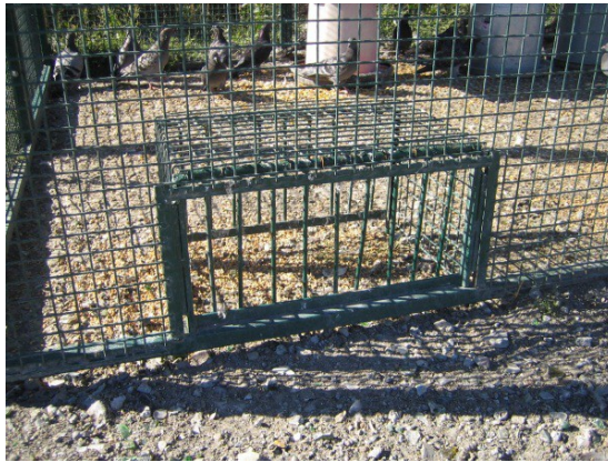
TOULOUSE CAGE POUR PIGEONS HARETS