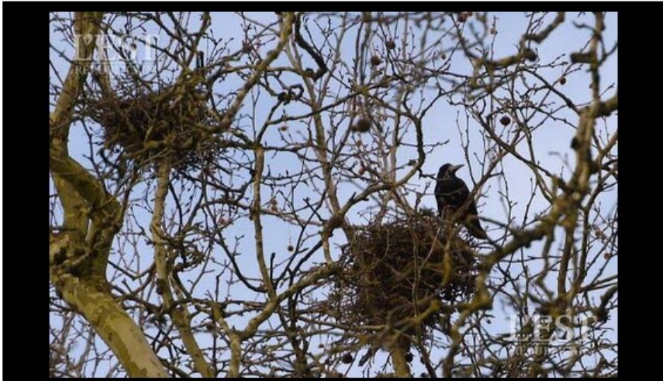
Pour les associations de protection des oiseaux, il existe d'autres méthodes que la destruction des nids pour lutter contre les nuisances occasionnées par les corvidés.