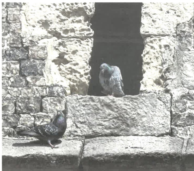
À Ault, le pigeon n'est plus le bienvenu dans les rues. Lundi 17 avril, une société spécialisée a procédé à la régulation de la population.

Les cadavres sont ensuite ramassés, mis dans un sac et enlevé par une société d'équarrissage. « C'est la société qui vient sur place pour voir si la population est en hausse et